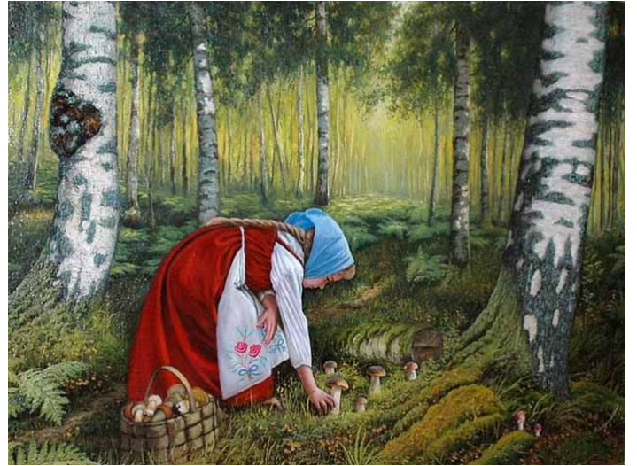
Рис. 5 Пуртов С.А. Девочка с грибами