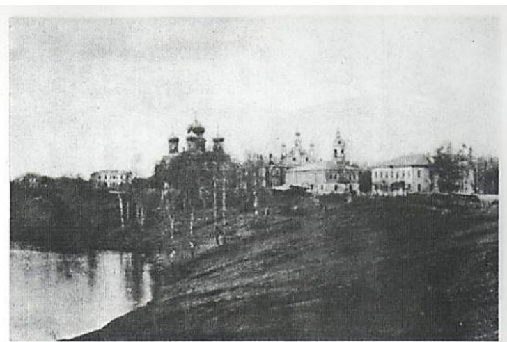
Фото 16. Набережная. Слева: дом Удельного округа, дальше – Преображенский собор. Весенний разлив р. Ваги