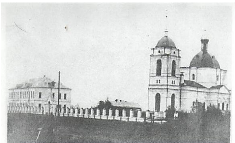
Фото 26. Церковь Святителя Николая-угодника. Заложена в 1905 г., разрушена в 40-е годы. Слева: богадельня