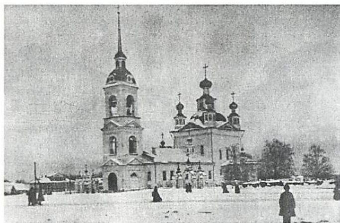
Фото 1. Троицкий собор. Заложен в 1742 г., разрушен в 1937–1950 гг. Фото С. Следникова, 1910 г.