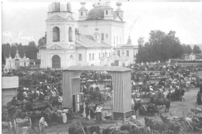
Фото 5. Троицкий собор. Вид со стороны алтарной части