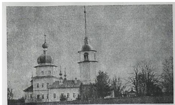
Фото 20. Церковь Успения Святой Богородицы на кладбище. Построена в 1796 г.