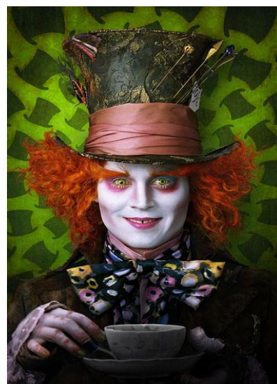
Рис. 7 Безумный Шляпник