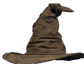
Рис. 6 Шляпа Хогвардца