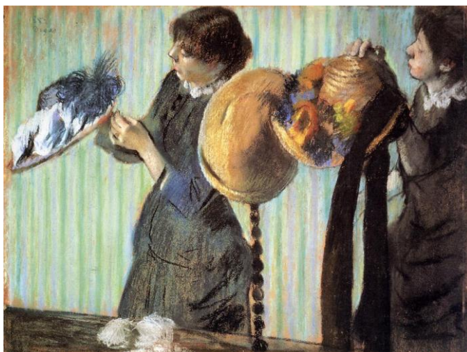
Рис. 3 Модистки. Эдгар Дега