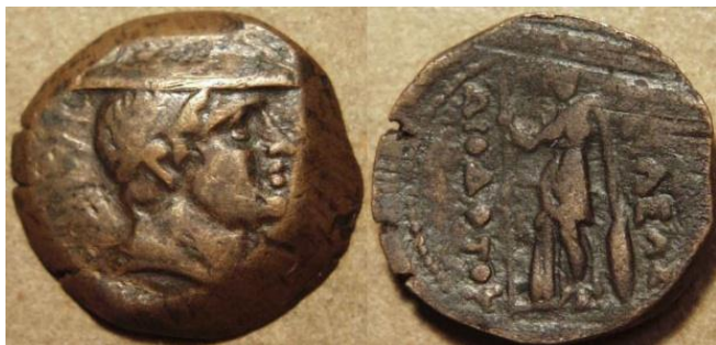
Рис. 1 Монета с изображением Гермеса, одетого в петатос