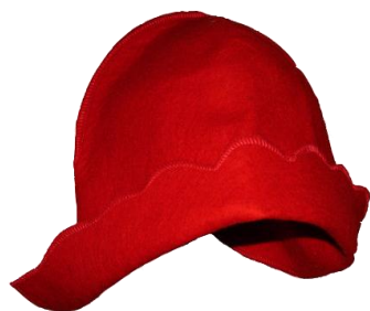
Рис. 5 Красная Шапочка