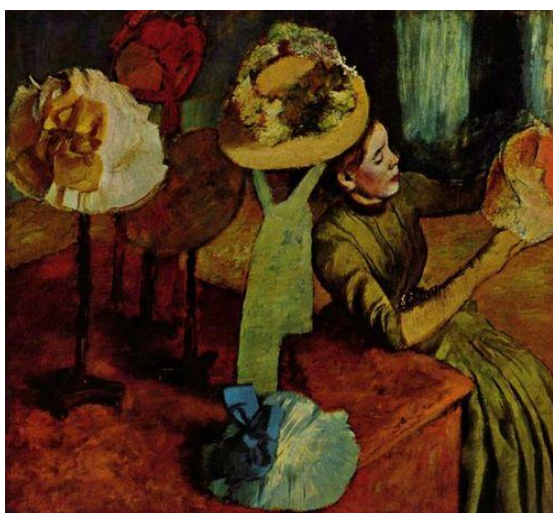
Рис. 4 Модистка. Ателье дамских шляп. Эдгар Дега