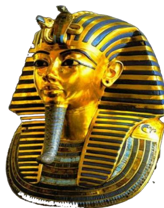
Рис. 2 Изображение фараона в плате из полосатой ткани